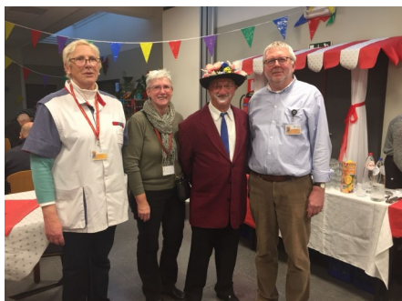
Vrijwilligers van het ziekenhuis hielpen mee aan een mooie middag met Vlaamse kermis voor de patiënten.